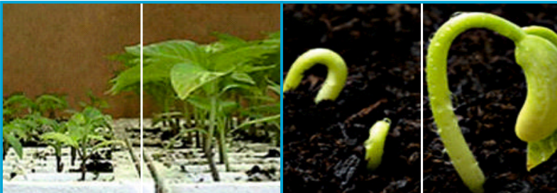
प्रक्रिया करने से पहले प्रक्रिया करने के बाद परिणाम प्रक्रिया करने से पहले प्रक्रिया करने के बाद परिणाम