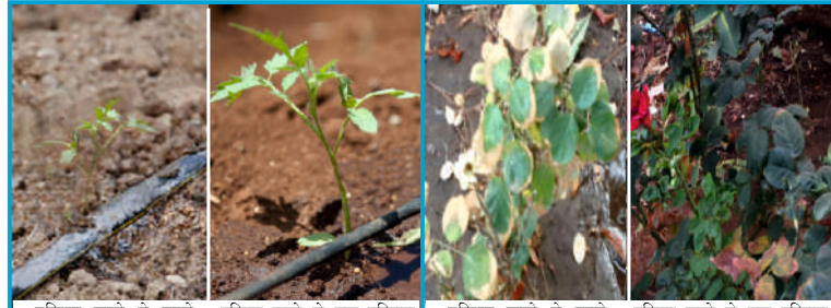
प्रक्रिया करने से पहले प्रक्रिया करने के बाद परिणाम प्रक्रिया करने से पहले प्रक्रिया करने के बाद परिणाम

खारे पानी में घूले खनिजों पे हमरा कोई नियंत्रण नही, पर ऐसे पानी के उपर प्रक्रिया कर हम उसे उपयोग लायक बना सकते हैं। तथास्तु वॉटर कंडिशनर से खारे पानी मे जो क्षारकन होते हैं। उनका विघटन होकर चिपकने की उनकी क्षमता १०० प्रतिशत नष्ट हो जाती है। ऐसे पानी से जमीन के उपर सफेद परत (सोरा) जमा नही होता और पेहेले जमा सफेद परत (सोरा) थोडे दिनों में कम हो जाता है और डिपर एवं स्पिंकलर जाम होने की तकलिफ से हमेशा के लिए छूटकारा मिलता है। इस प्रक्रिया से पानी भौतिक दृष्टि से हलका होकर फसल की मुलियों तक आसानी से पोहच जाता है। जिसकी वजह से फसल के पत्ते जलने का प्रमाण कम हो कर उत्पादन मे बढोतरी होती है।