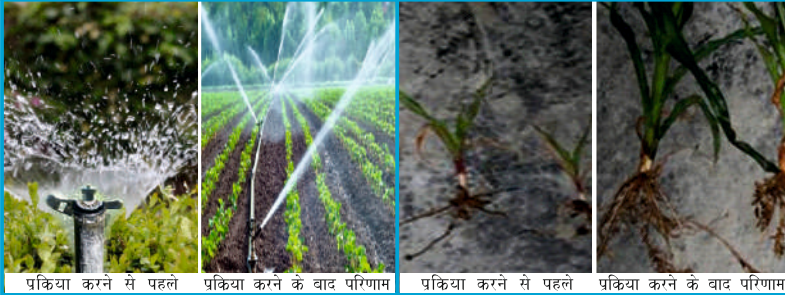
प्रक्रिया करने से पहले प्रक्रिया करने के बाद परिणाम प्रक्रिया करने से पहले प्रक्रिया करने के बाद परिणाम

तथास्तु वॉटर कंडिशनर भारत के विभिन्न कृषि विद्यालय के साथ मिलकर विकसित और परिक्षण किया गया है। साथ ही महाराष्ट्र कर्नाटका राजस्थान तमिलनाडु तथा जर्मन के नामी डॉक्टर और वैज्ञानिकों ने भी अपना योगदान दिया है।