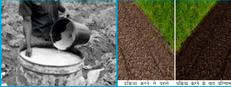
प्रक्रिया करने से पहले प्रक्रिया करने के बाद परिणाम