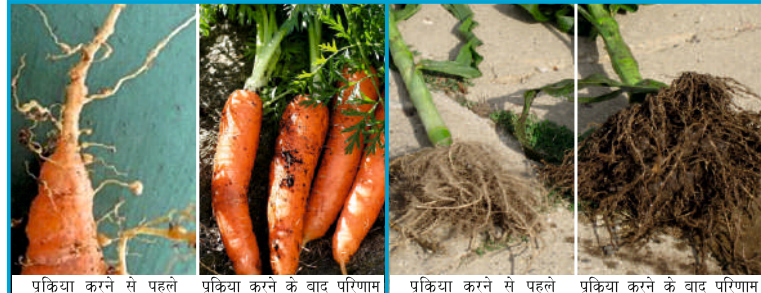
प्रक्रिया करने से पहले प्रक्रिया करने के बाद परिणाम प्रक्रिया करने से पहले प्रक्रिया करने के बाद परिणाम